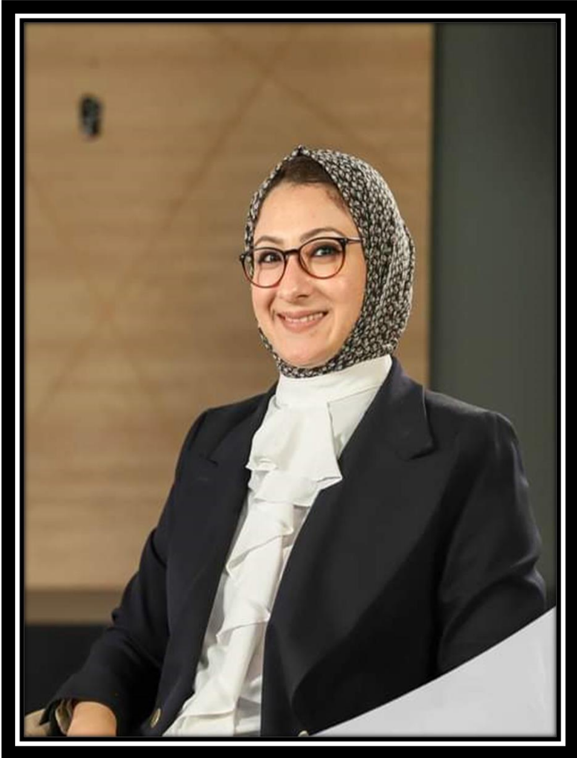
حنان مجدي نور الدين محافظة الوادي الجديد نائب محافظ الوادي الجديد